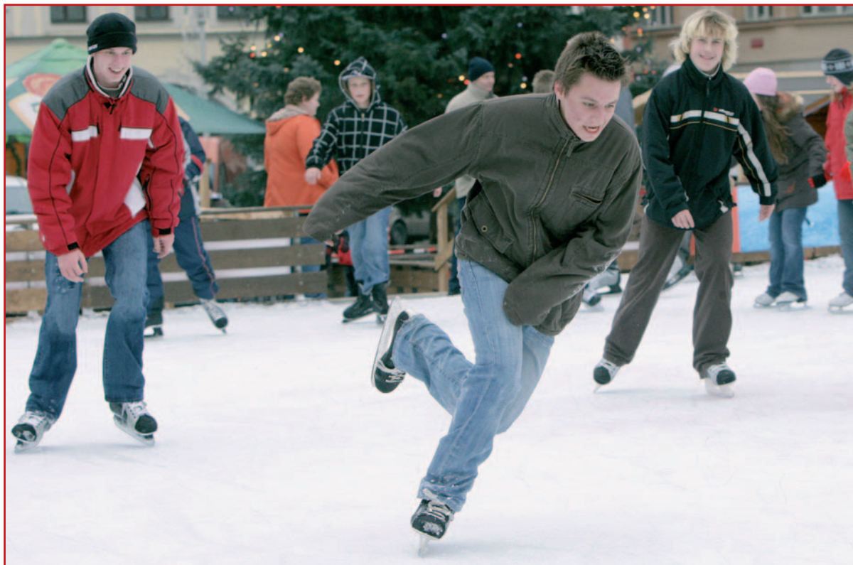
Už druhý rok po sobě si mohli obyvatelé i návštěvníci Českých Budějovic o adventu a po Vánocích až do Tří králů zabruslit pod vánočním stromem na náměstí Přemysla Otakara II. Možnost zabruslit si v centru města přivítala hlavně mládež, rodiče s dětmi, ale také náhodní kolemjdoucí.