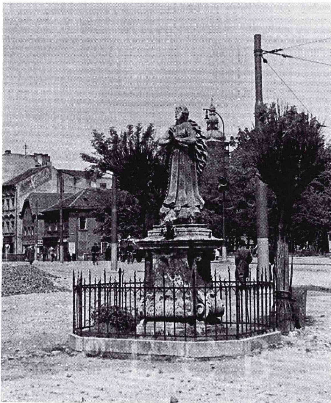
Senovážné náměstí: barokní socha panny Marie Budějovické stála před Svinenskou bránou, 1950, sbírka J. Dvořáka; SOKA.