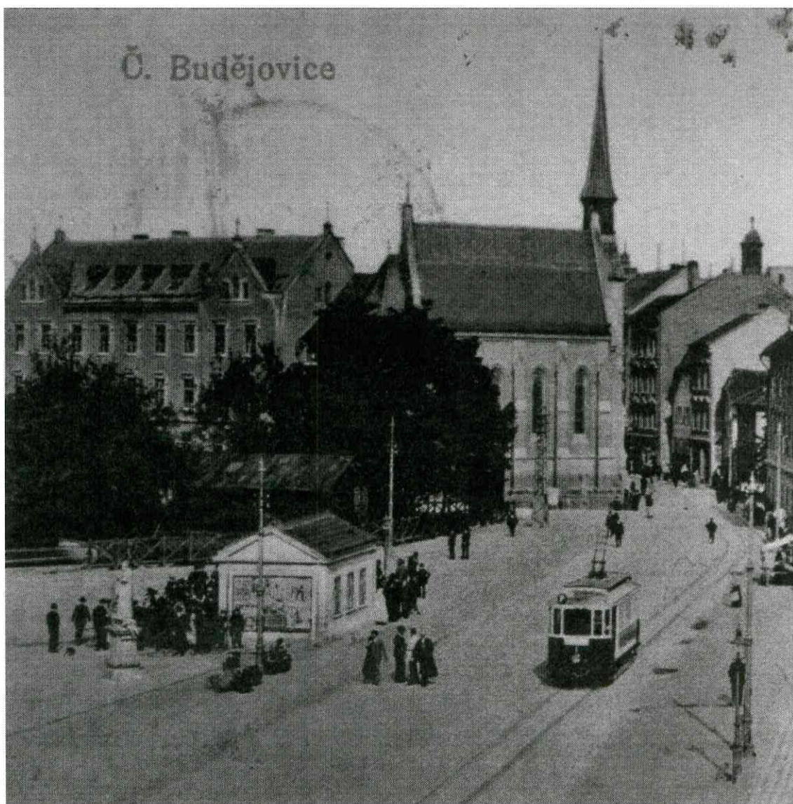
Umístění sochy Panny Marie na Senovážném náměstí – v levém spodním rohu