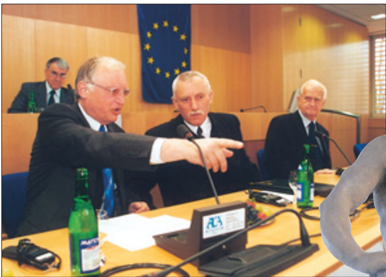
Člen Evropské komise EU Günter Verheugen (zleva) navštívil České Budějovice a setkal se zde s hejtnanem Jihočeského kraje Janem Zahradníkem a primátorem statutárního města Miroslavem Tetterem.

V rámci programu rozvoje kraje existuje projekt Splavnění Vltavy, který, podle náměstkových slov, navazuje na (pokračování na str. 2)