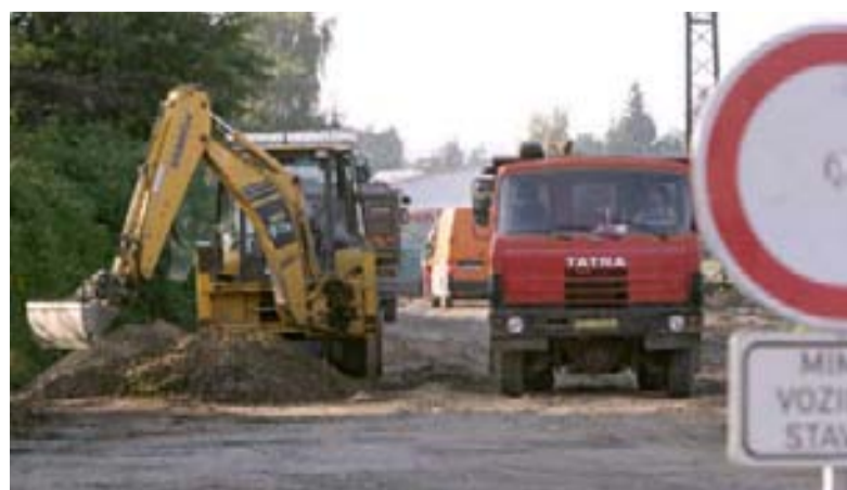
Stavba Zanášdražní komunikace již začala.

Následovat bude další etapa Zanášdražní komunikace, a to od Rudolfovske ulice směrem k Jiho-transu. Obě stavby by náměstek Jelen rád viděl už na jaře příštího roku hotové.