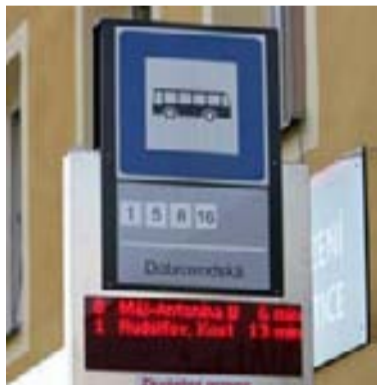
Nové zastávky s digitálním displejem.

Na nový informační systém, který funguje na některých zastáv-