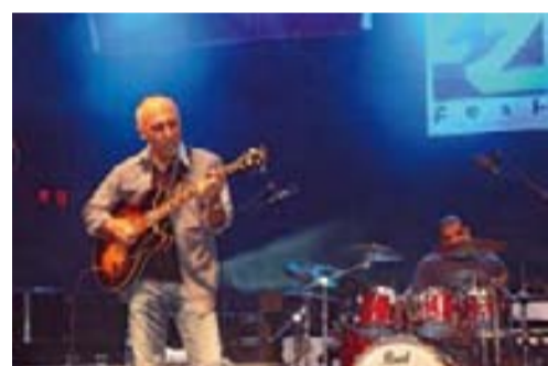
Larry Carlton na pódiu v Českých Budějovicích.