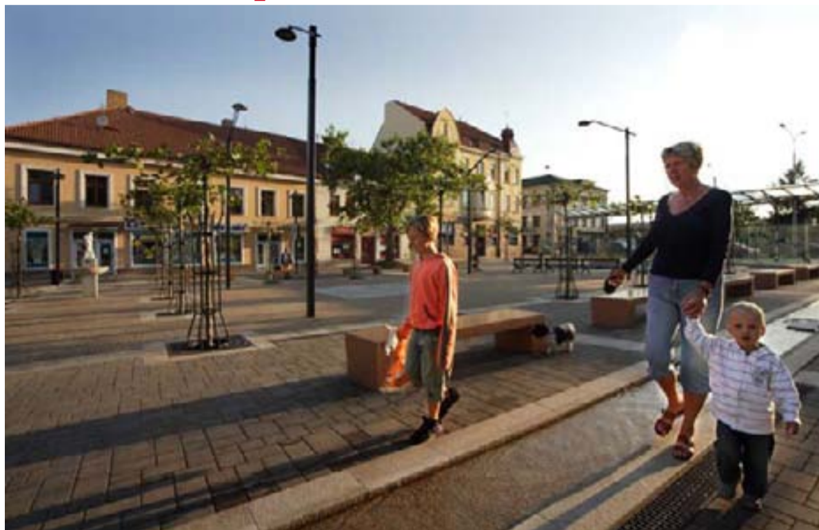
Nová Lannova třída je důstojným bulvárem.

„Evropské finanční prostředky ve výši 48,5 milionů korun z Regionálního operačního programu Jihozápad stavbě významně pomohly. Doufám, že se nejen místním občanům, ale i těm, kteří k nám zavítají, bude nová třída líbit a stane se