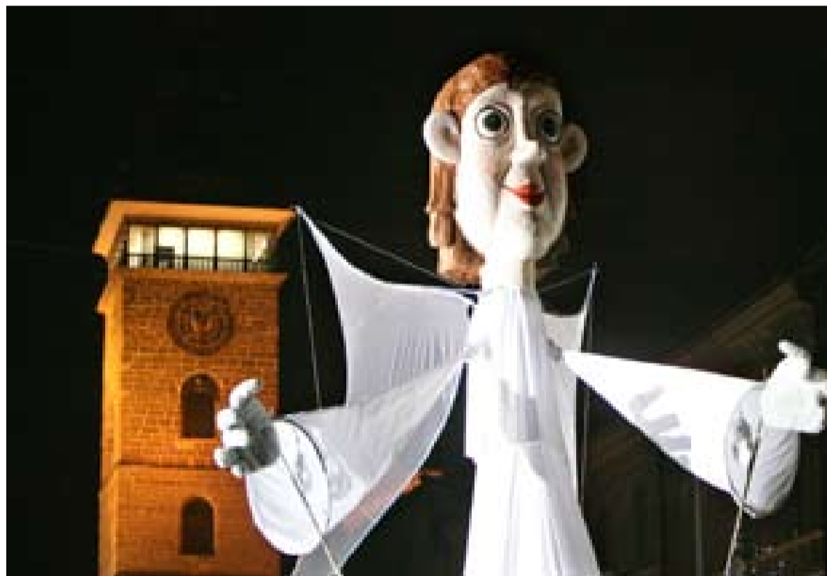
Obří loutka přála lidem na náměstí vše nejlepší do nového roku.