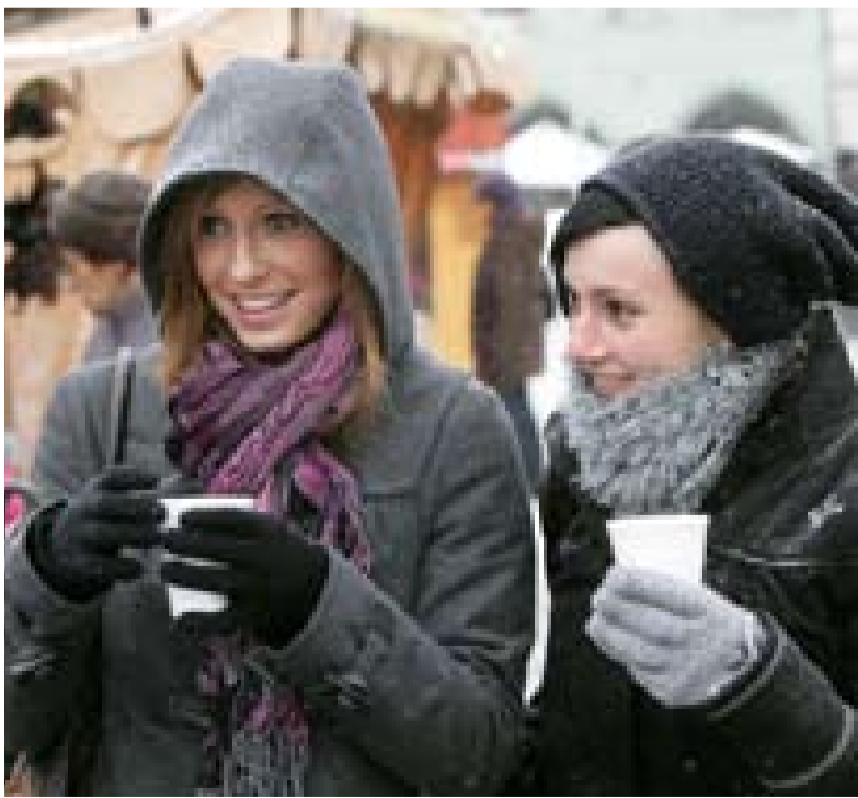
O vánoční pohodu se na náměstí při trzích postaraly i lahodné horké nápoje, jako např. punč.

Tento projekt je zařazen v tematickém Integrovaném plánu rozvoje města a město již požádalo o dotaci z Regionálního operačního programu NUTS II Jihozápad.