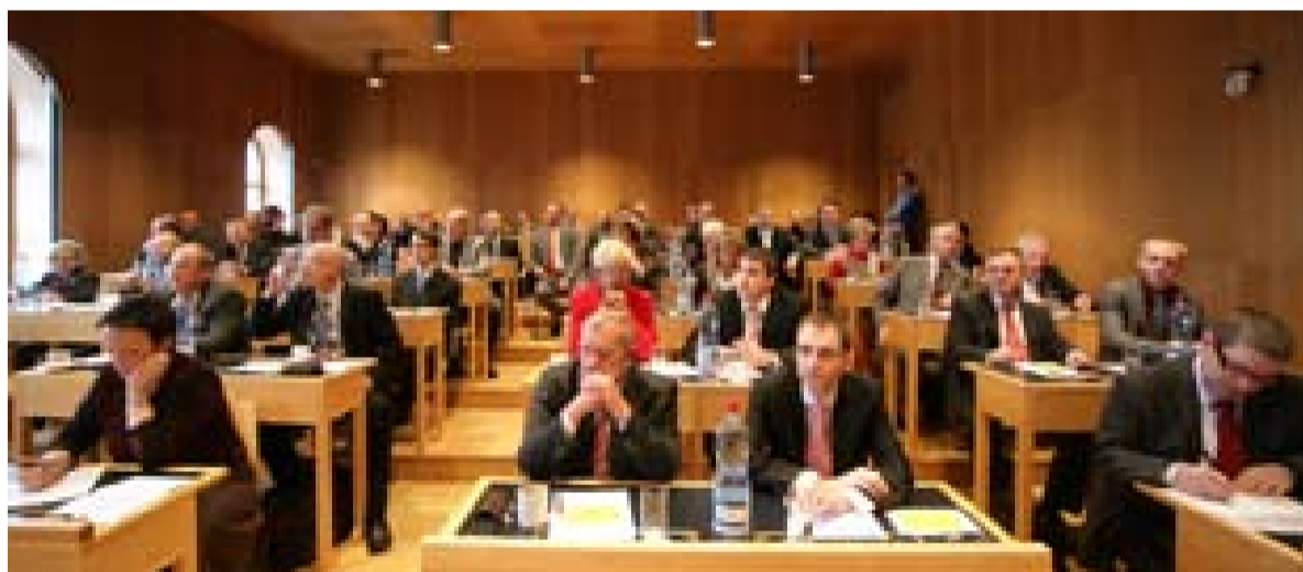
Nově zvolené zastupitelstvo se do konce roku sešlo dvakrát. Snímek je z volby primátora.