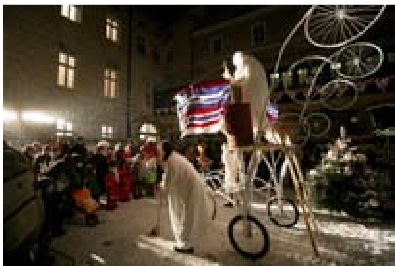
Vánoční představení divadla Kvelb na nádvoří radnice navštívily stovky lidí.

Strážníci zakoupili také čtečku, která je k dispozici na operačním středisku MP ČB. „Můžeme jí registrovaná kola kontrolovat v databázi. Registraci do této databáze provádí každý majitel jízdního kola sám na www.krimistop.cz,“ dodala Bíro.