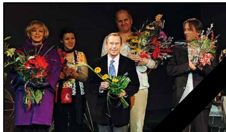
Smutek za Havla. Týden před Vánocemi České Budějovice vzpomínaly na prezidenta Václava Havla. Lidé podepisovali kondolence a před radnicí spontánně zapalovali svíčky. Město ve spolupráci s Jihočeským divadlem připravilo čtené představení jeho poslední hry Odcházení, jejíž premiéry v Českých Budějovicích v roce 2008 se prezident zúčastnil osobně.

„Jedná se o největší organizační změnu. S převodem agendy vyplácení sociálních dávek na úřady práce s účinností od 1. ledna poklesne počet zaměstnanců o 21,“ přiblížil změnu primátor Juraj Thoma (HOPB). Náměstek primátora Petr Podhola (ČSSD) však doplnil, že se odbor více zaměří na systém včasné intervence, romskou otázku, protidrogovou politiku a kuratorství pro děti a mládež.