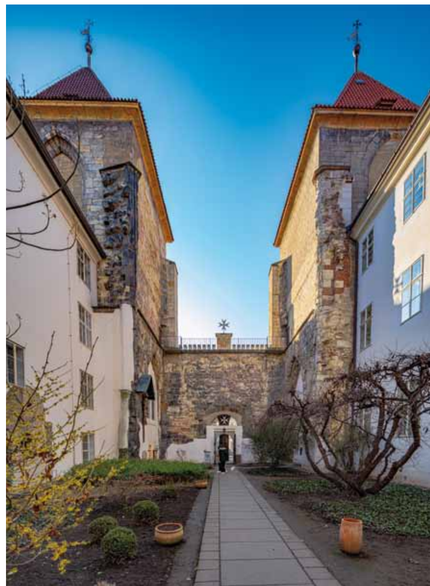
▲ Původní prostor johanitské komendy u kostela Panny Marie pod řetězem v Praze. Zde patrně došlo ke scéně mezi arcibiskupem Janem z Jenštejna a králem Václavem IV. Současný stav.

V době Jana z Pomuku tvořila kapitula u sv. Víta poradní sbor arcibiskupův a jeho senát. Tehdy platné církevní právo dekretální vázalo těsněji biskupa na poradu s kapitulou a votum kanovníků mělo rozhodující vliv na platnost biskupova právního úkonu. Biskup byl povinen jednat „cum consensu capituli“. A právě této skutečnosti si byl Václav IV., který patřil mezi nejinformovanější vládců své doby, velmi dobře vědom. Proto také přikázal odvést zatčené preláty do kapitulní síně. Zde se shromáždili ti členové svatovítské kapituly, kteří byli v té době v Praze přítomni. V jejich čele stál děkan kapituly, významný právník, profesor pražské