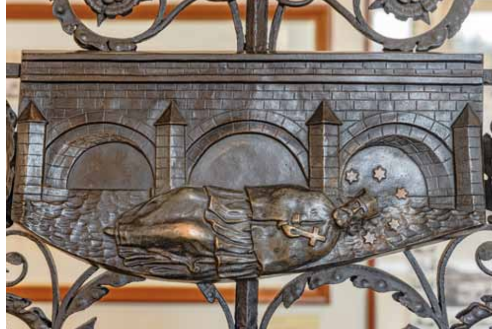
▲ Karlův most – Reliéf sv. Jana Nepomuckého v místě shozu.