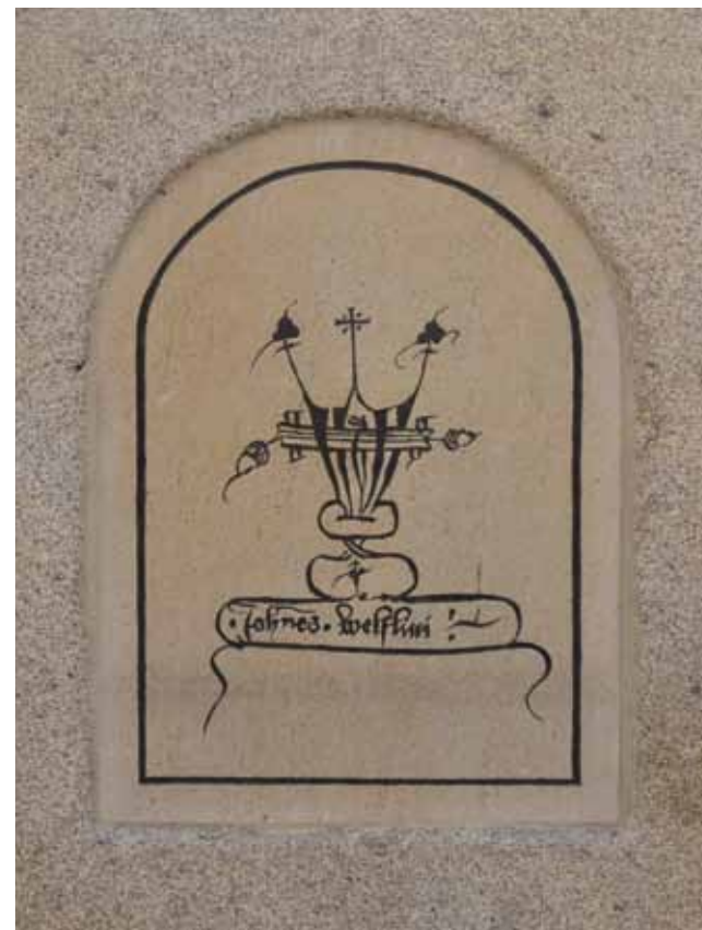
▲ Detail sochy sv. Jana Nepomuckého v Českých Budějovicích Na Sadech. (Celek sochy obálka a str. 2.)