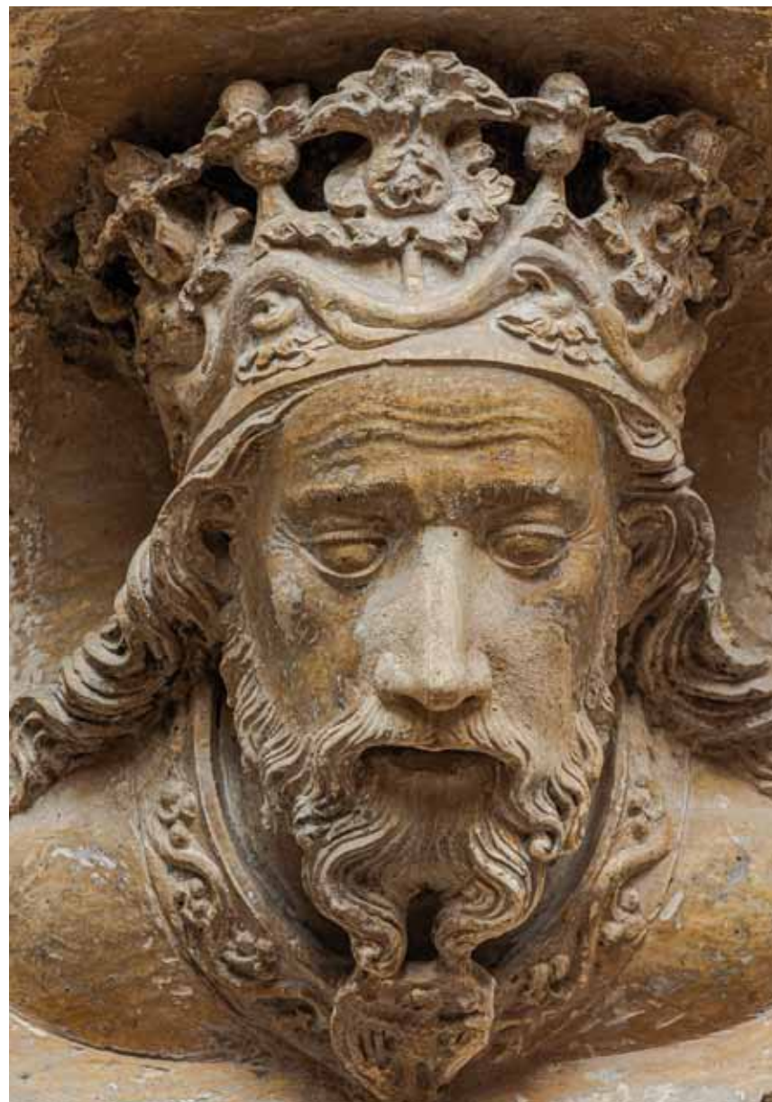
▲ Václav IV. podobizna z tympanonu Týnského chrámu v Praze.